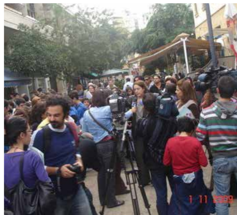
Περπατάμε μαζί και μαθαίνουμε τα μνημεία της πόλης μας, 1 Νοεμβρίου 2009